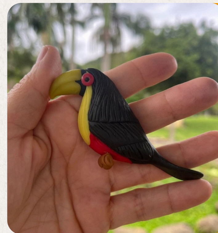
TUCANO DO BICO VERDE RAMPHASTOS DICOLORUS

Elegante habitante de manguezais e áreas alagadas. Peça em biscuit: 12x5 cm • 50 g • Imã, chaveiro, boton ou souvenir.