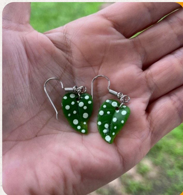
BEGÔNIA MACULATA BEGÔNIA MACULATA

Peça em biscuit: 7×7×5 cm • 50 g • Ideal como peça decorativa, imã ou boton.