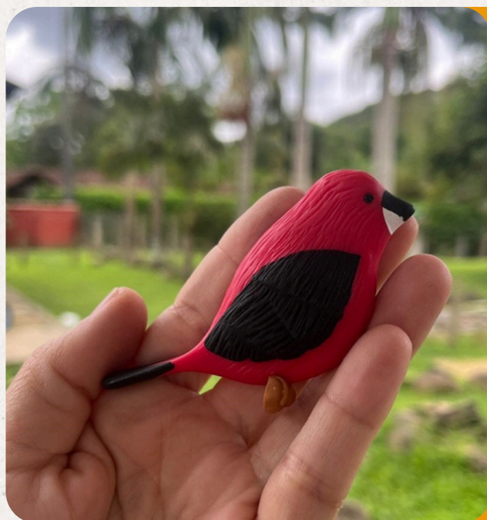
TIÉ-SANGUE RAMPHOCELUS BRESILIUS

Azul e amarela, comum em jardins e bordas de mata do Sudeste. Peça em biscuit: 8×5×3,5 cm • 50 g • Imã, chaveiro, boton ou lembrança.