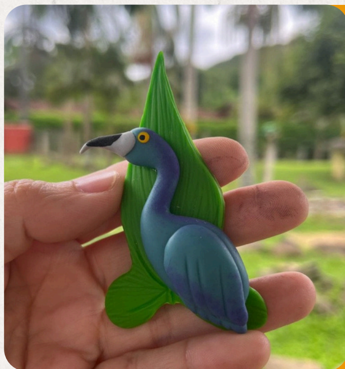
GARÇA AZUL EGRETTA CAERULEA

Elegante habitante de manguezais e áreas alagadas. Peça em biscuit: 12x5 cm • 50 g • Imã, chaveiro, boton ou souvenir.