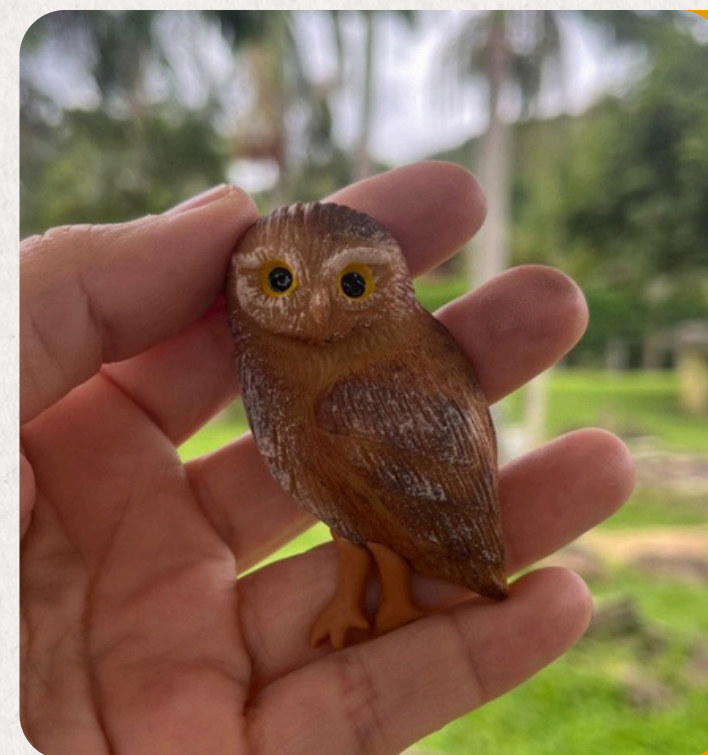
CORUJA BURQUEIRA ATHENE CUNICULARIA

De vermelho intenso e asas negras, típica do litoral do Paraná. Peça em biscuit: 9×6×4 cm • 50 g • Imã, chaveiro, boton ou souvenir.