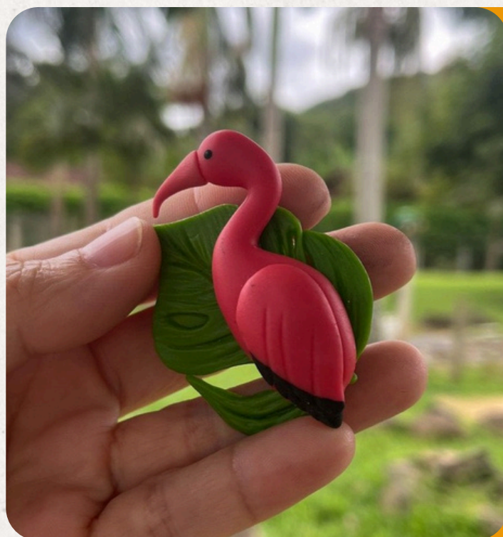
GUARÁ EUDOCIMUS RUBER

Símbolo da Mata Atlântica, destaca-se pelo bico colorido e o voo elegante entre as copas. Peça em biscuit: 10x6x4 cm • 50 g • Imã, chaveiro, boton ou decorativa.