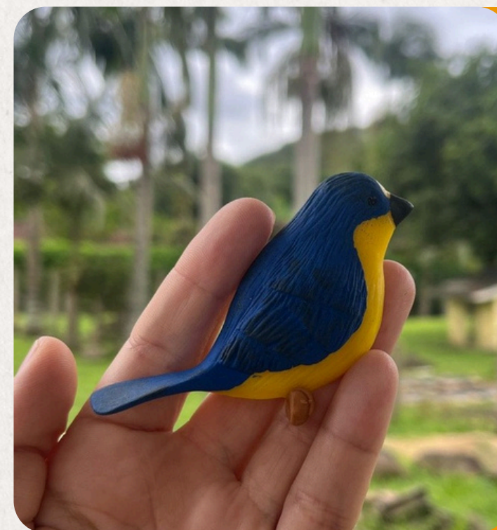
BONITO-LINDO EUPHONIA CHLOROTICA

Colorida e vibrante, símbolo da Mata Atlântica. Encontrada nas florestas do Sul e Sudeste. Peça em biscuit: 10×6×4 cm • 50 g • Imã, chaveiro, boton ou decorativa.