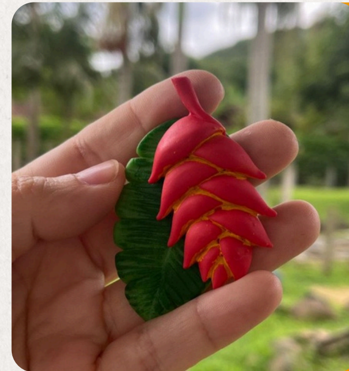
BROMÉLIA BROMELIACEAE SPP.

Peça em biscuit: 9×6×4 cm • 50 g • Imã, chaveiro, boton ou lembrança artesanal.