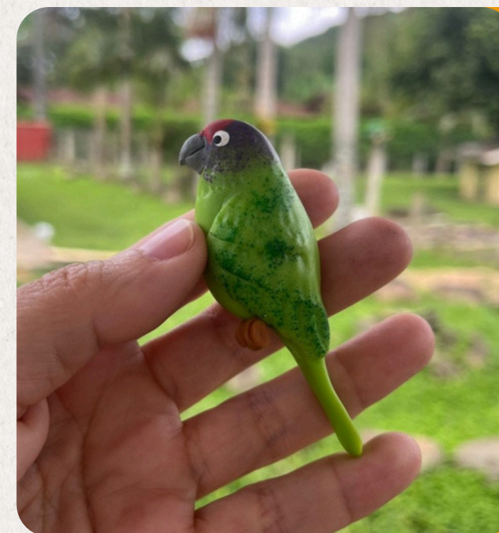
PAPAGAIO DA CARA ROXA RAMPHASTOS DICOLORUS

Ave dos manguezais, com plumagem vermelha intensa. Peça em biscuit: 11x5 cm • 50 g • Imã, chaveiro, boton ou lembrança artesanal.