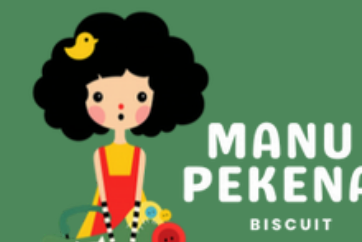
TABELA DE PREÇOS 2026