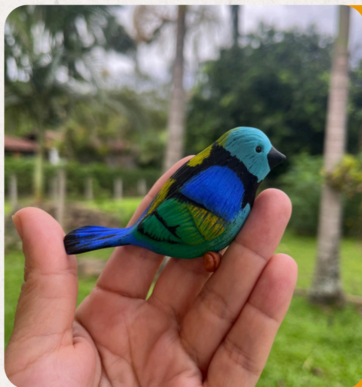
SAÍRA 7 CORES TANGARA SELEDON

Colorida e vibrante, símbolo da Mata Atlântica. Encontrada nas florestas do Sul e Sudeste. Peça em biscuit: 10×6×4 cm • 50 g • Imã, chaveiro, boton ou decorativa.