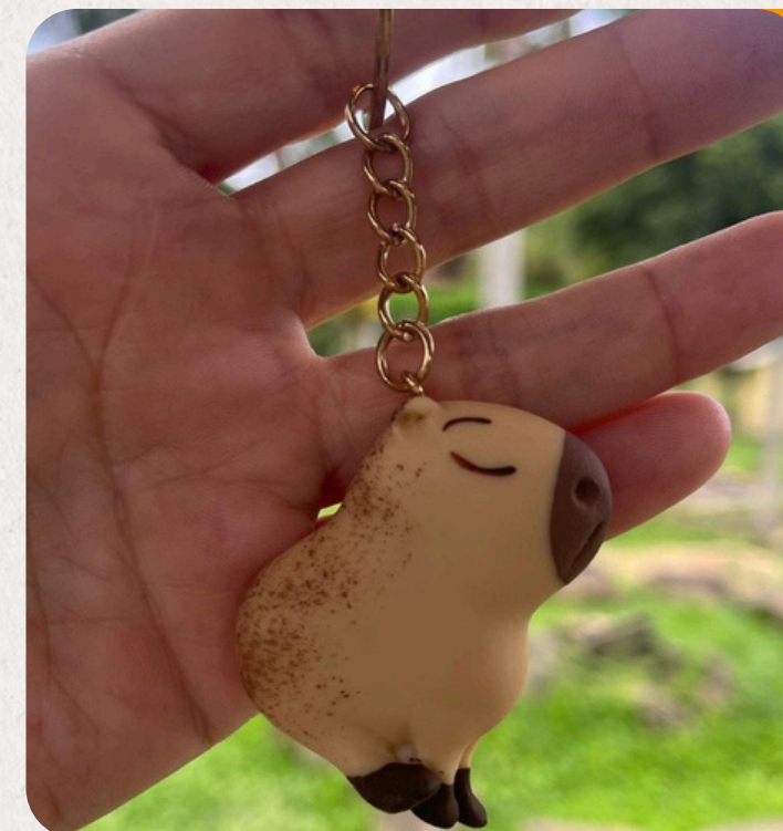
CAPIVARA HYDROCHOERUS HYDROCHAERIS

Famosa pelas folhas verdes salpicadas de branco e verso avermelhado, muito usada em vasos ornamentais. Peça em biscuit: 7×6×4 cm • 50 g • Vendida exclusivamente no formato brinco artesanal.