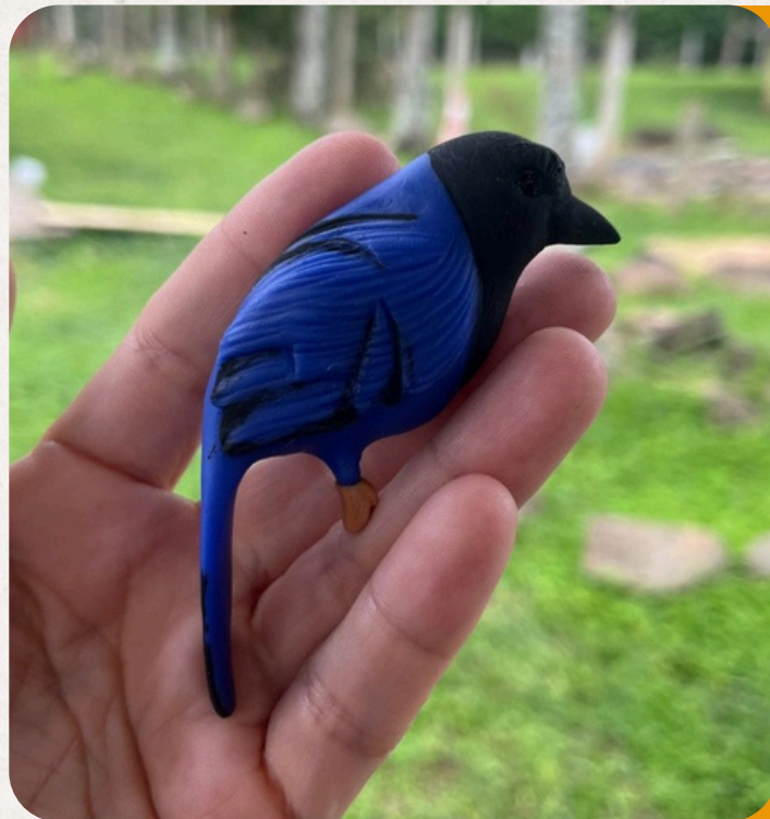
GRALHA AZUL CYANOCORAX CAERULEUS

Ave símbolo do Paraná, guardiã das araucárias e da floresta.